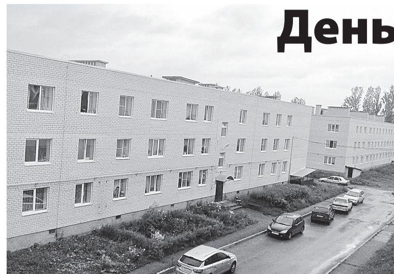
Растут дома на улице Потерпелицкой