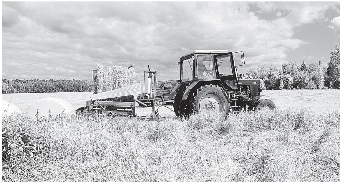
Технология «Сенаж в упаковке» позволяет «Агро-Волоку» готовить корма стабильно высокого качества

Наряду с заготовкой кормов в сельхозорганизациях и хозяйствах района идёт уборка ранних сортов картофеля и овощей.