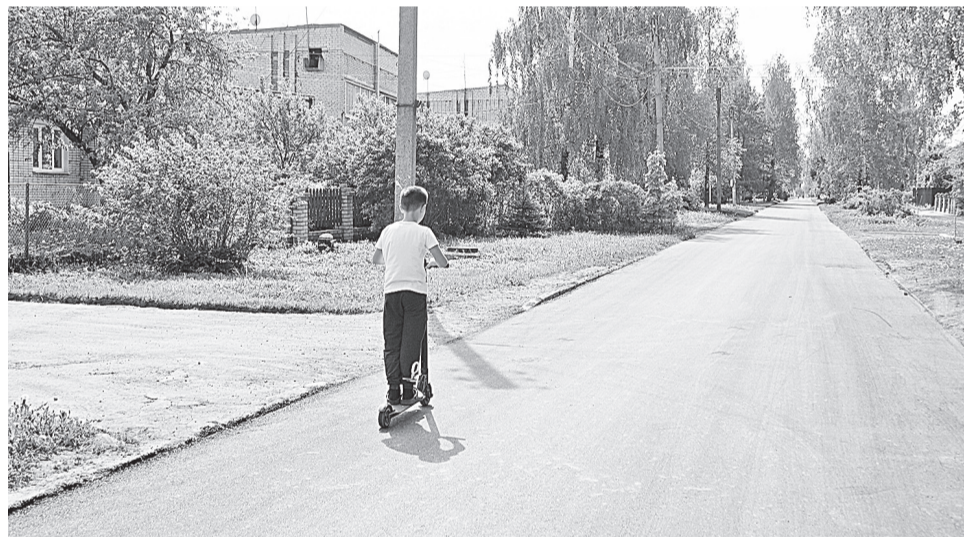
Дорога в Лесновском поселении Новгородского района — первая ласточка проекта «Дорога к дому»

В итоге заявки представили 142 поселения. Общая протяженность местных дорог, подлежащих ремонту в рамках проекта, составила порядка 134 км. Некоторые отнеслись к проекту со скептицизмом. Не сумели психологически перестроиться. Мол, как это сами люди будут решать? Никогда такого не было! Но таких, к счастью, оказалось немного. Большинство быстро оценили новые возможности. Благо в малых поселениях особо долго выбирать не требуется. Главных дорог, ведущих к социально значимым объектам (это условие участия в проекте), там не так много, а зачастую и вообще одна. В большей степени дело зависело от организованности жителей и оперативности работы органов местного самоуправления.